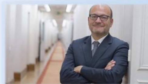
Remy Rioux – Prezes AFD

Centrum Rozwoju ( Development Center ) OECD ( http://www.oecd.org/dev/ ) gościło, 6 marca 2017 roku, Pana Remy Rioux – od 2 czerwca 2016 roku prezesa Agence Française de Développement (AFD www.afd.fr ) z wykładem na temat strategii działania tej instytucji. AFD nie przypomina typowej agencji pomocy rozwojowej, gdyż jest zarazem instytucją finansową i główną agencją wdrażającą francuską oficjalną pomoc rozwojową w krajach rozwijających się i zamorskich terytoriach Francji.