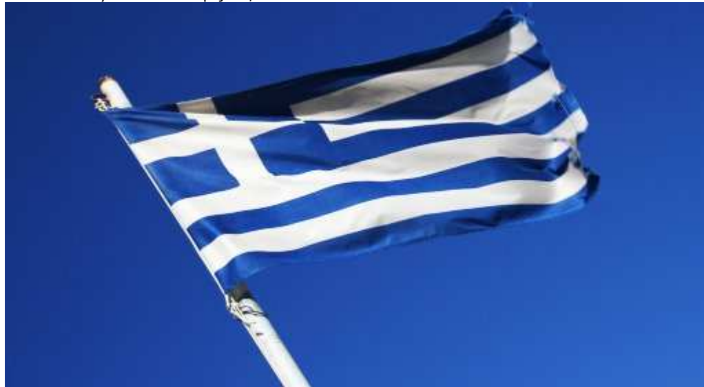
Flaga Grecjifot. SXC

"Bardzo Ważny Problem Europejski", 8 września 2011