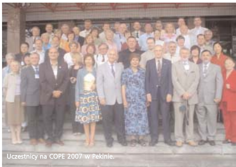
Uczestnicy na COPE 2007 w Pekinie.

Więcej informacji na temat działalności COPE znaleźć można na www.copeintl.org