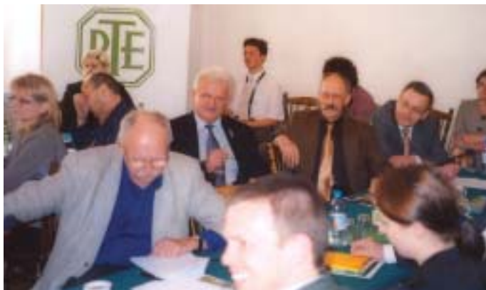
W czasie seminarium z cyklu „Czwartki u ekonomistów” – „Podatek liniowy – mit czy realna szansa”.