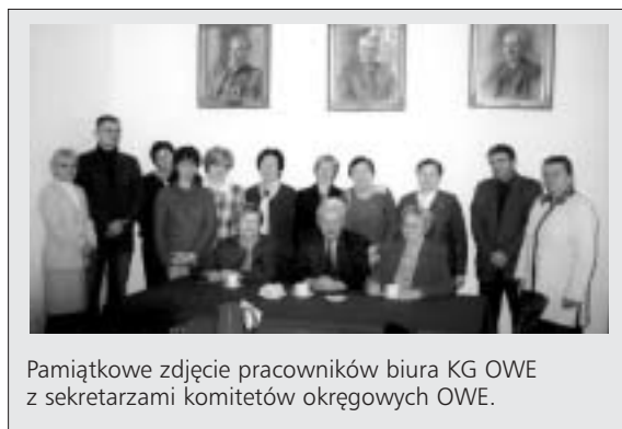
Pamiątkowe zdjęcie pracowników biura KG OWE z sekretarzami komitetów okręgowych OWE.